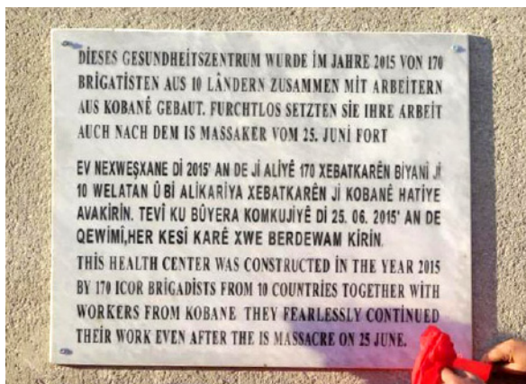
Gedenktafel zur Gebäudeübergabe

Bei Angabe des Namens und der Adresse geht Ihnen eine Spendenbescheinigung zu. Ihre Spende wird ausschließlich zum Aufbau des Gesundheits- und Sozialzentrums in Kobanê eingesetzt!