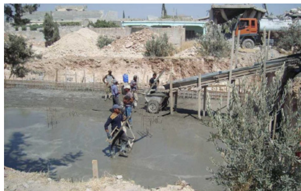
Gießen der Bodenplatte